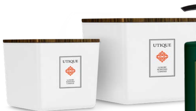
GRAPEFRUIT & ORANGE BLOSSOM