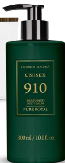
PURE ROYAL 910